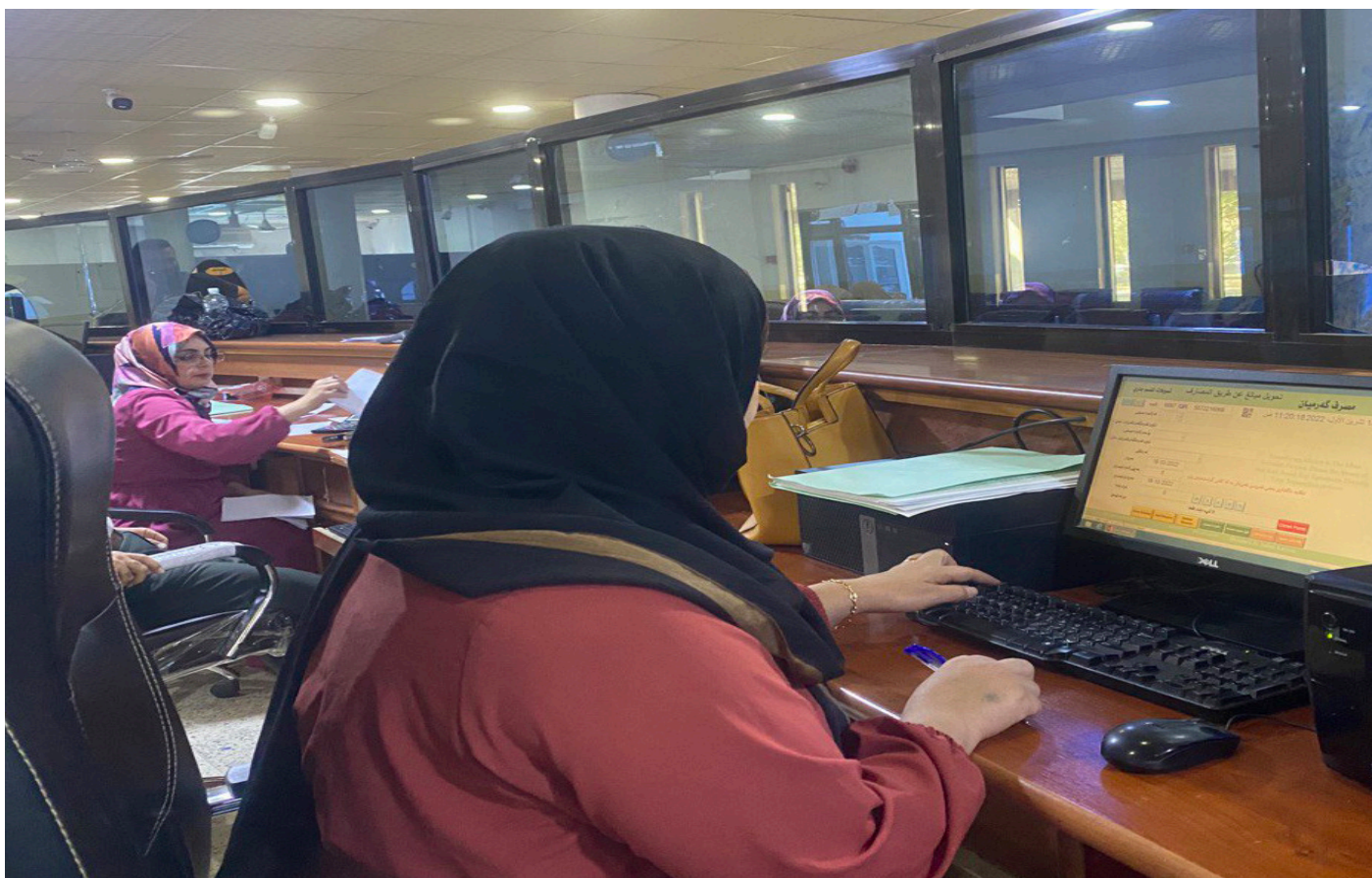
فەرمانبەریکی بانکی گەرمیان لە کاتی راییکردنی کاروباری هاوڵاتیان