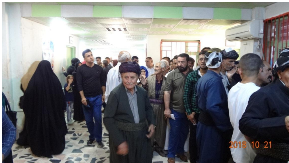
دىمەنىك له بهشى راوێژكارى نەخۆشخانهى گشتى كه لار

له ئىستادا ژمارهى دانىشتوانى گەرميان به پىي ئاماره نافهرميهكان زياتر له نيومليۆن كهسى تىپهراندهه، بهلام نەخۆشخانهكهى بۆ قەزايەك گونجاوه كه دانىشتوانى (۱۰۰) ههزار كهس تىپهراندهه، هۆكارى ئەم پالەپهستۆيهش بۆ زۆرى ژمارهى دانىشتوان دهگەریتتوه ئەمه سهپهراى ئەوهى به پىي لىدوانى بهشى ئىدارهى نەخۆشخانهكه ۲۵% ى نەخۆشەكانى ناوچه دابىرنراوهكانىش دینه نەخۆشخانهكه و نزمى لايەنى ئابورى دانىشتوانى ناوچهكه هۆكارىكى دىكهى ئەم پالە پهستۆ زۆرهى نەخۆشخانهكهيه.