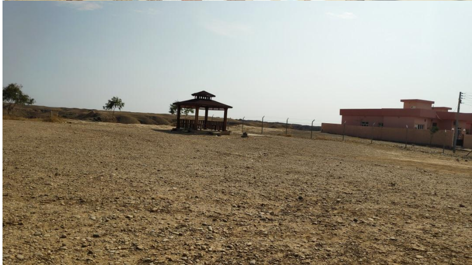
وینە ی دو پرۆژە ی گهشتیاری که له کفری دروستکراون